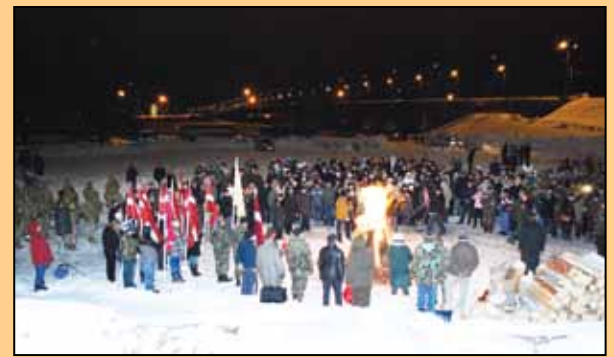
2011. gada 13. janvāris. Barikāžu atceres ugunsgrabs Zaķusalā, uz kuriem visi, kas vēlējas varēja aizbraukt ar Olaines Kultūras centra organizēto autobusu.

13. janvārī Rīgā, krastmalā notika vislatvijas tautas manifestācija, kurā piedalījās vairāk kā pusmiljons cilvēku. Todien Rīga kļuva par barikāžu pilsētu, barikādes tika izveidotas ap nozīmīgākajām valsts un sabiedriskajām ēkām. Tie, kas no Olaines barikādēs piedalījās organizēti, tika nosūtīti apsargāt televīzijas ēku Zaķusalā.