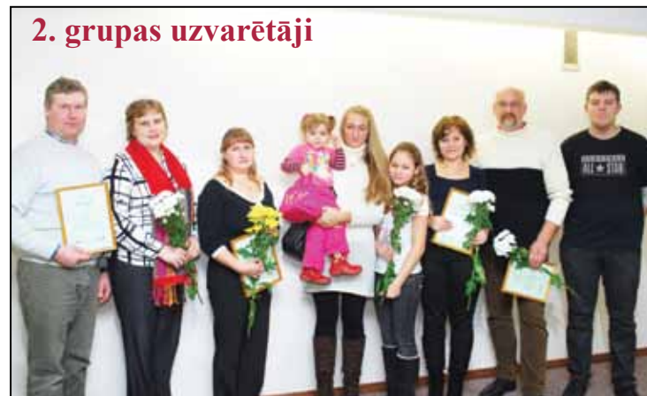
2. grupas uzvarētāji