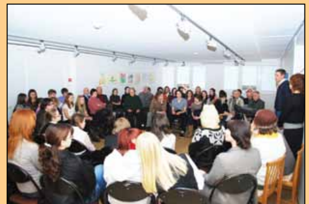
2011. gada 20. janvāris. Barikāžu atceres pasākums Olaines Vēstures un mākslas muzejā. Savās atmiņās dalījās barikāžu dalībnieki, stāstot jauniešiem par tā laika notikumiem un izjūtām.

Muzeja aicināti, jaunieši bija uzklauzījuši sev zināmos barikāžu dalībniekus un pierakstījuši viņu atmiņas.