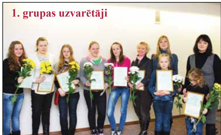
1. grupas uzvarētāji

17.janvārī Olaines novada pašvaldības Dzimtsarakstu nodaļas zālē tika godināti konkursa „Ziemassvētku un Jaunā gada noskaņas veidošanas noformējums 2010” uzvarētāji un dalībnieki.